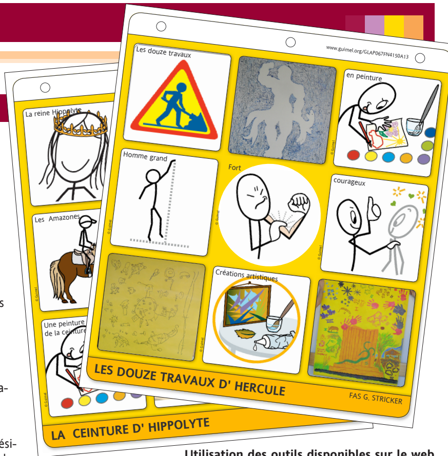
Utilisation des outils disponibles sur le web pour la création de supports visuels personnalisés

Création de posters et extension du vocabulaire pour mieux rendre visible les projets d’accompagnement personnalisés des résidents du FAS/FAM G. Stricker.