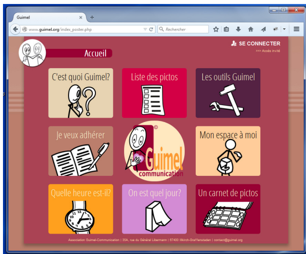
La nouvelle page d’accueil du site www.guimel.org

A toutes et à tous, un grand merci pour votre intérêt et votre soutien, quel qu’il soit.